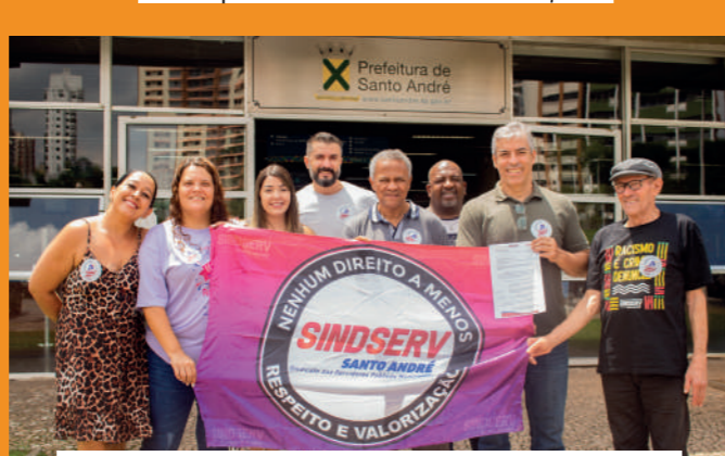
Dirigentes do Sindserv Santo André