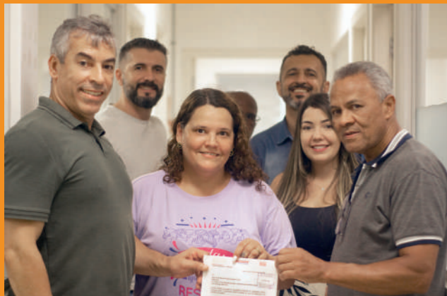
Diretoria do Sindserv protocola pauta na PMSA