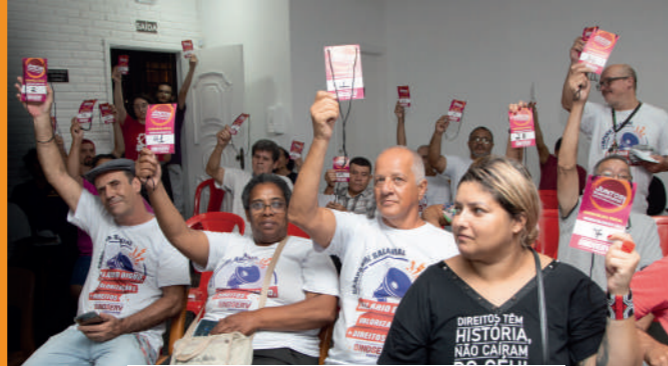
Servidores aprovam pautas da Campanha Salarial • Foto: Valdir Lopes