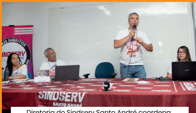
Diretoria do Sindserv Santo André coordena Assembleia da Campanha Salarial